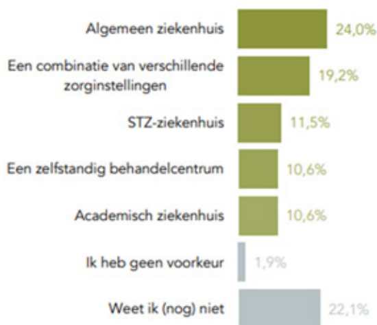
Figuur 2. Waar aios na hun opleiding willen werken.