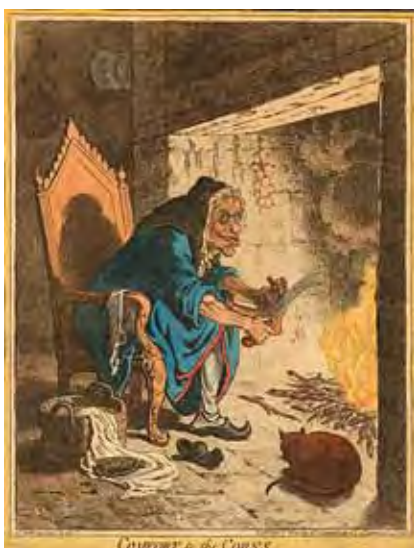
Figuur 1. 'Comfort to the corns' door James Gillray, gepubliceerd in 1800. Gravure Bethesda, Mld., National Library of Medicine.