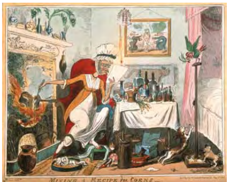
Figuur 2. 'Mixing a Recipe for Corns' door George Cruikshank, ingekleurde ets, versie 1835. Wikimedia Commons.