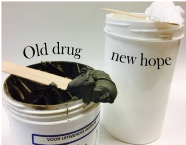
Figuur 2. Teerzalf: obsoleet of vernieuwend?

screeningsmodellen hebben helaas niet geleid tot een nieuw teer-zasje. Wel zijn we tot fundamentele kennis omtrent de rol van de AHR in de huid gekomen, en zijn we nog lang niet uitgeleerd. Inmiddels is de eerste AHR-ligand voor topicale behandeling van psoriasis en atopisch eczeem ontwikkeld [10] en door de FDA goedgekeurd. Resultaten van fase 3 studies met Tapinarof (GSK2894512, Dermavant), een natuurlijke AHR ligand, in volwassen psoriasis vulgaris patiënten [11] zijn veelvuldig besproken in recente edities van de JAAD.