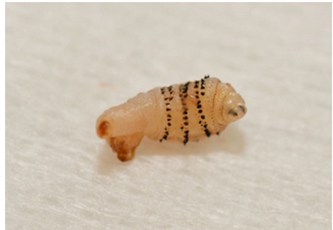
Afbeelding 2. De boosdoener, met op zijn thorax multipiele en bij de mondholtte een tweetal weerhaakjes.