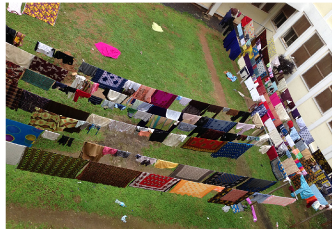
Afbeelding 4. De binnentuin van het KCMC ziekenhuis in Moshi, Tanzania. In Afrika wordt de was dikwijls op de grond gedroogd. De toemboevlieg kan hier zijn eitjes op achterlaten.