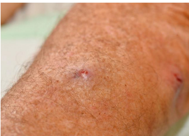
Afbeelding 1b. Op deze arm zijn de typische steenpuistachtige papels goed zichtbaar.