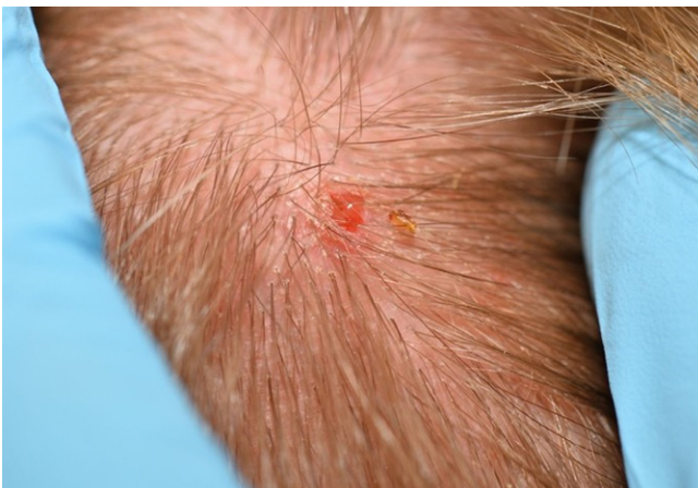
Afbeelding 1a. De (onbedekte) scalp is een voorkeurslocatie voor deze parasiet.

met wat vaseline, verschijnen er luchtbelletjes, als teken dat er inderdaad iets levends onder de huid lijkt te zitten dat adem probeert te halen. De dermatoloog probeert na het plaatsen van een klein sneetje het 'onderhuidse beestje' los te peuteren, maar dat blijkt nog niet zo gemakkelijk. Met meerdere weerhaakjes aan zijn thorax kan het organisme zich behoorlijk stevig verankeren. Toch trekt de dermatoloog uiteindelijk zowel letterlijk als figuurlijk aan het langste eind (afbeelding 2)