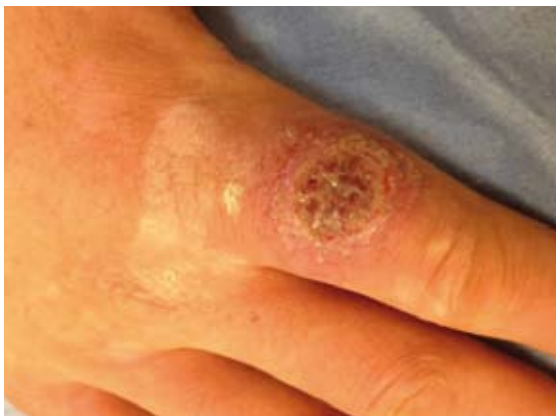
Figuur 1. Wond ter hoogte van de wijsvinger.

De diagnose van (muco)cutane leishmaniasis is in de eerste plaats gebaseerd op de kliniek. 1 Bij een cutane leishmaniasis ontwikkelen de letsels zich 2 weken tot 3 maanden na de beet door een besmette zandvlieg. Dit begint doorgaans met een rode papul die over een periode van 1 tot 3 maanden evolueert naar een erythemateuze nodule, plaque of ulceratie.