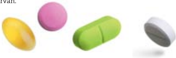
Tabel 1: Resultaten enquête Dermatica.

Een aanzienlijk deel van de respondenten weet niet of onvoldoende waar informatie te vinden is over niet-leverbare geneesmiddelen, maar heeft die behoefte wel. Ook het verschil tussen een handelspreparaat en een doorgeleverde bereiding is niet iedereen duidelijk, evenals de vergoedingssystematiek hiervan.