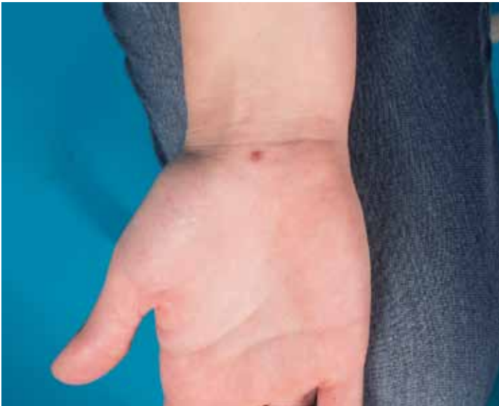
Figuur 1. Klinisch beeld.