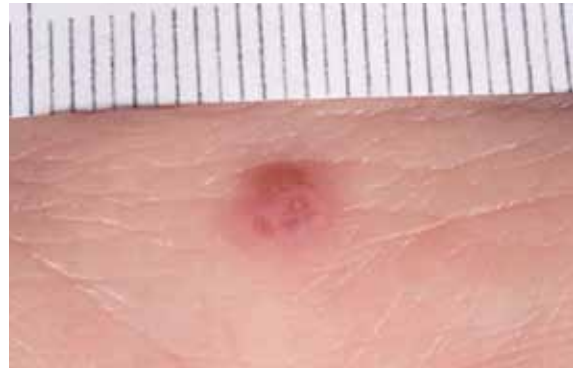
Figuur 2. Macroscopisch beeld.