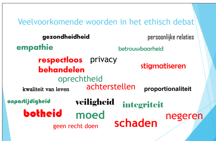
Figuur 1: Veelvoorkomende woorden in het ethisch debat

Ethisch gevoelig zijn situaties waarbij aannemelijk is dat sprake is van een dilemma (bijvoorbeeld het afwegen van kwaliteit van leven tegen kosten), of dat er ethische vragen gesteld worden (bijvoorbeeld of behandeling x wel in het belang van de patiënt is? Hoe verhoudt zich het belang van de patiënt tegenover dat van de familie?). Een beperkt overzicht van veel gebruikte termen in het ethisch debat staat in figuur 1. In dit artikel spreken wij van ethische 'kwesties' in plaats van 'dilemma's'. In een dilemma is sprake van of-of, soms moet je kiezen uit twee kwaden en er is altijd een handelwijze/strategie die men niet verkiest. De termen 'kwestie' of 'probleem' zijn meer bescheiden en vragen om suggesties voor oplossingen.