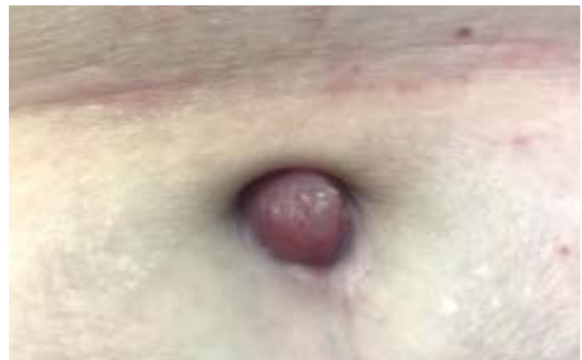
Figuur 1. Erythemateuze nodus in de navel.