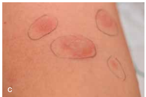
Figuur 1. Klassieke beeld van mycoplasma geïnduceerde huid- en slijmvliesafwijkingen met ernstige orale mucositis met hemorrhagische crustae zowel oraal als nasaal (A), genitale blaarvorming (B) en beperkte vesiculobulleuze, atypische targetlaesies (C).