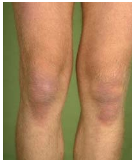
Figuur 1 Teken van Gottron: symmetrisch gelokaliseerde livide atrofische maculae aan de strekzijden van de knieën.