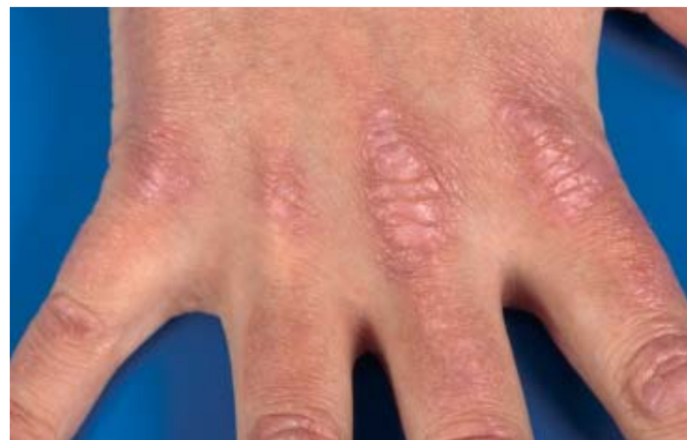
Figuur 2 Papels van Gottron: symmetrische livide niet-schilferende papels aan de dorsale zijde van de interfalangeale en metacarpofalangeale gewrichten.