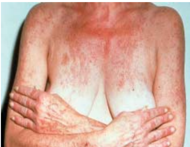
Figuur 4 Foto-geïnduceerd erytheem symmetrisch aanwezig aan de strekzijden van de armen en handen, op de schouders en het coeur.